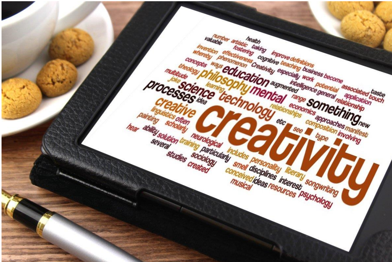
Creativity von Nick Youngson, CC BY-SA http://nyphotographic.com/