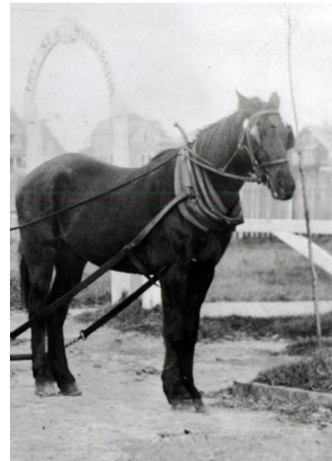
Horsemobile von NHAL. Copyright abgelaufen